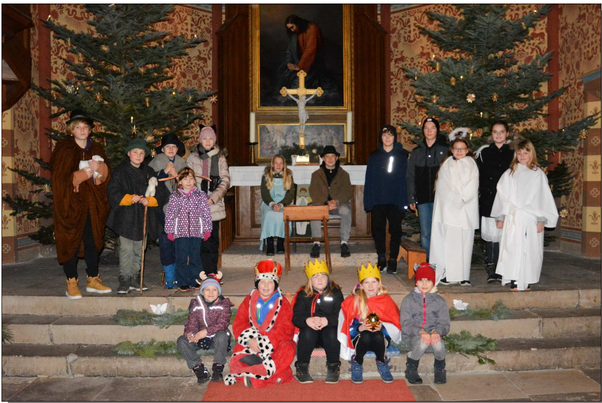
Krippenspiel in der Schloßkirche Letzlingen am Heiligabend 2022