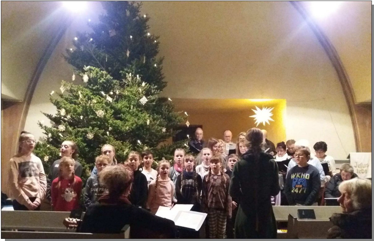
Konzert im Dezember 2022 mit dem Kirchenchor Mieste-Dannefeld und den Drömlingsspatzen in der Kirche Sachau